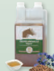
1 l Dosierflasche

Fütterungsdauer: Um eine optimale Wirkung zu erreichen, sollte die Fütterung in Form einer vier- bis sechswöchigen Kur erfolgen. Bei Bedarf kann die Fütterungsdauer bis zu 3 Monate betragen.