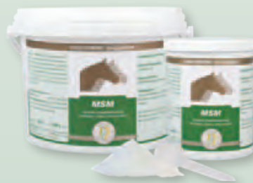
2 kg Eimer | 800 g Dose

Fütterungsdauer: Um eine optimale Wirkung zu erreichen, sollte die Fütterung über einen längeren Zeitraum (3-6 Monate) erfolgen.