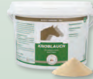
1,5 kg Eimer

Fütterungsdauer: Um eine optimale Wirkung zu erreichen, sollte die Fütterung über einen längeren Zeitraum (2-3 Monate) erfolgen.