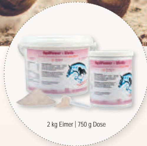
2 kg Eimer | 750 g Dose