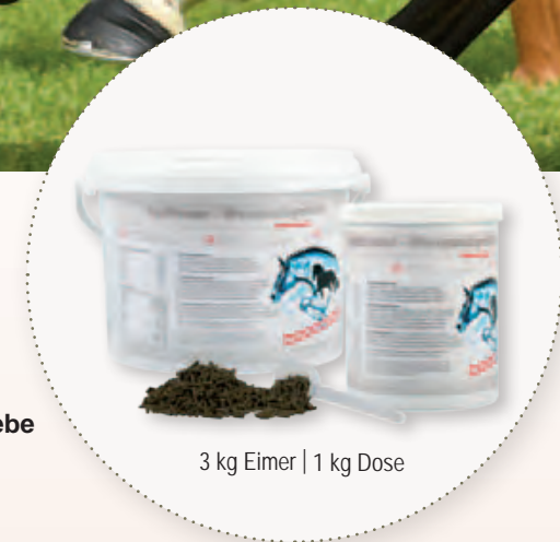
3 kg Eimer | 1 kg Dose