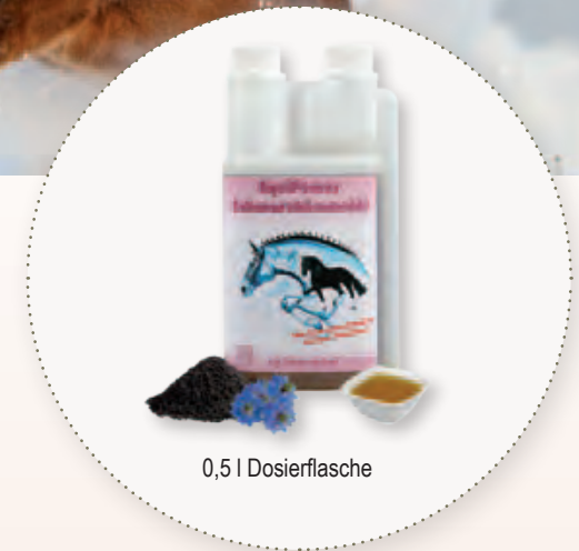
0,5 l Dosierflasche