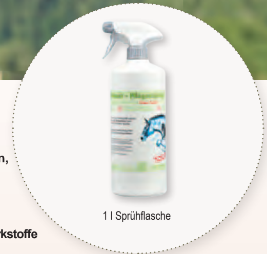
1 l Sprühflasche