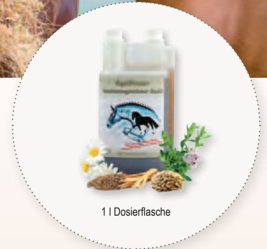
1 | Dosierflasche