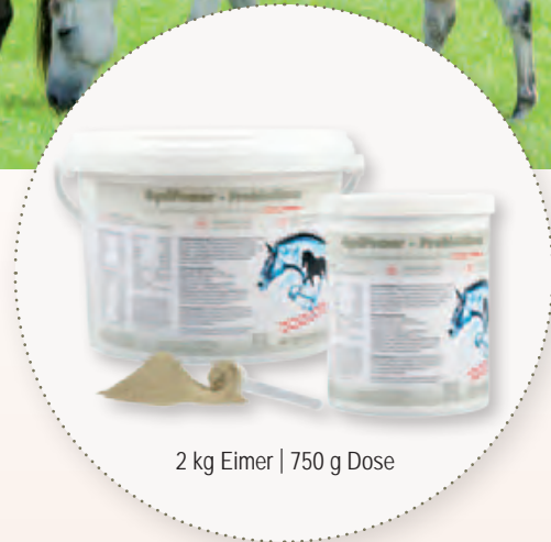
2 kg Eimer | 750 g Dose