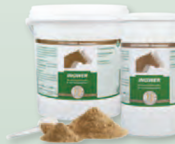
2 kg Eimer | 800 g Dose

Fütterungsdauer: Um eine optimale Wirkung zu erreichen, sollte die Fütterung in Form einer vier- bis sechswöchigen Kur erfolgen. Bei Bedarf kann die Fütterungsdauer bis zu 3 Monate betragen.