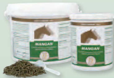
2 kg Eimer | 800 g Dose

Fütterungsdauer: Um eine optimale Wirkung zu erreichen, sollte die Fütterung in Form einer vier- bis sechswöchigen Kur erfolgen.