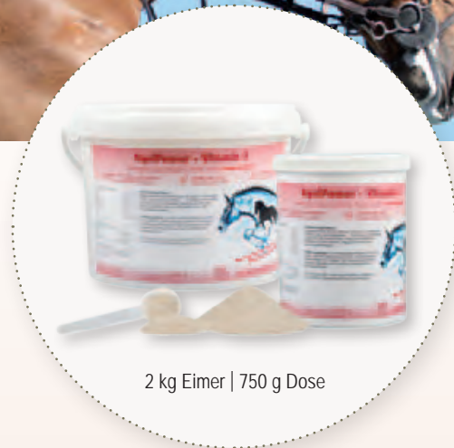
2 kg Eimer | 750 g Dose

Aufgrund des höheren Gehalts an Selen sollte die Tagesration nicht mehr als verdoppelt werden.