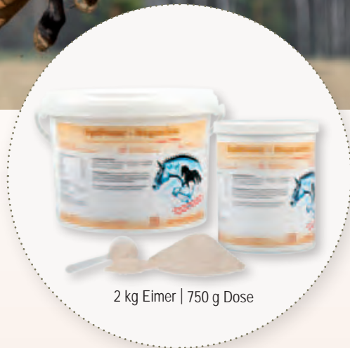
2 kg Eimer | 750 g Dose