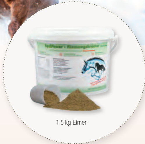
1,5 kg Eimer