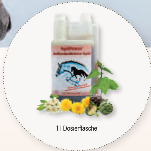
1 l Dosierflasche