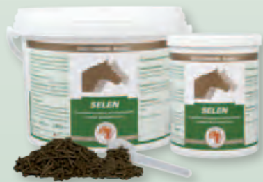
2 kg Eimer | 800 g Dose

Fütterungsdauer: Zur Unterstützung auf und der Erholung von sportlicher Anstrengung sollte die Fütterung bis zu 8 Wochen vor und 4 Wochen nach sportlicher Anstrengung erfolgen.