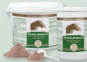
2 kg Eimer | 800 g Dose

Fütterungsdauer: Um eine optimale Wirkung zu erreichen, sollte die Fütterung in Form einer vier- bis sechswöchigen Kur erfolgen. Bei Bedarf kann die Fütterungsdauer bis zu 3 Monate betragen.