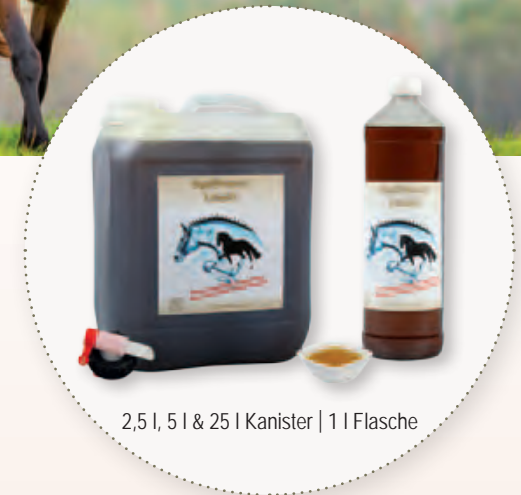
2,5 l, 5 l & 25 l Kanister | 1 l Flasche