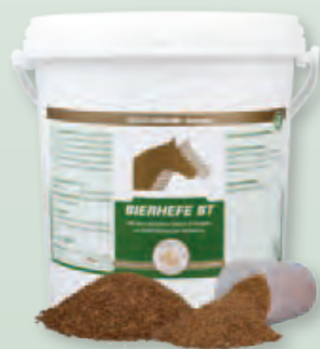
3 kg Eimer

Fütterungsdauer: Um eine optimale Wirkung zu erreichen, sollte die Fütterung über einen längeren Zeitraum (2-3 Monate) erfolgen.