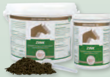
2 kg Eimer | 800 g Dose

Fütterungsdauer: Zur Unterstützung der Regenerierung von Hufen und Haut sollte die Fütterung bis zu 8 Wochen erfolgen.