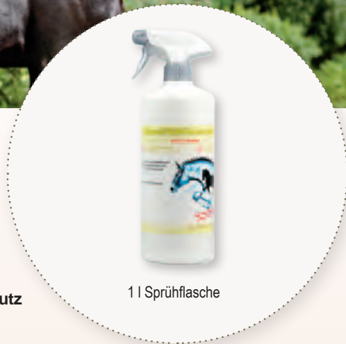
1 l Sprühflasche