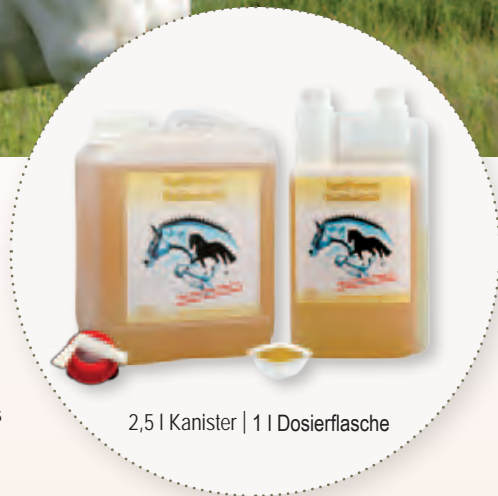
2,5 l Kanister | 1 l Dosierflasche