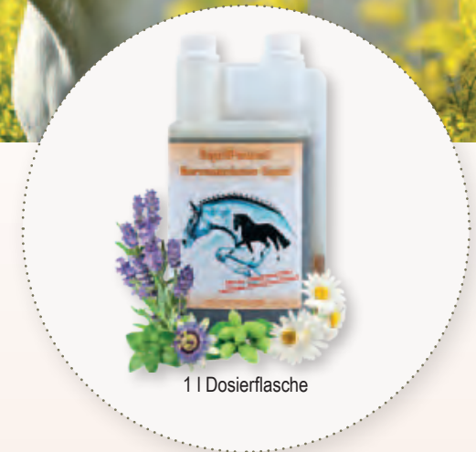
1 | Dosierflasche