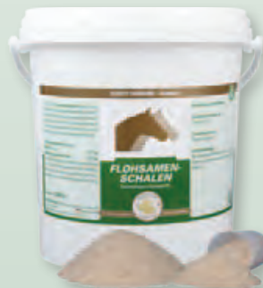
2 kg Eimer

Fütterungsdauer: Um eine optimale Wirkung zu erreichen, sollte die Fütterung in Form einer vier- bis sechswöchigen Kur erfolgen.