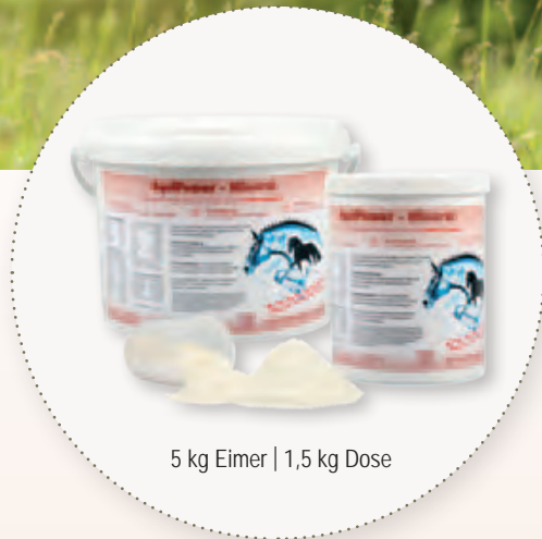
5 kg Eimer | 1,5 kg Dose